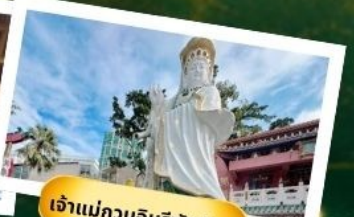
เจ้าแม่กวนอิมริพัลส์เบย์