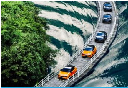
ถนนลอยน้ำด่านสิงโต