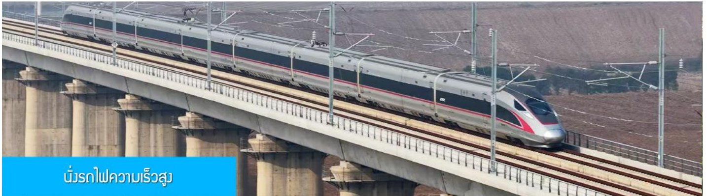
นั้รถไฟความเร็วสูง

เช้า รับประทานอาหารเช้า ณ ห้องอาหารของโรงแรม (10)