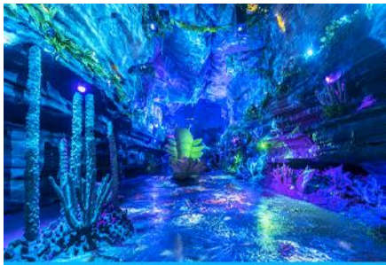
ป่าหิน สั่วปู้ย่า