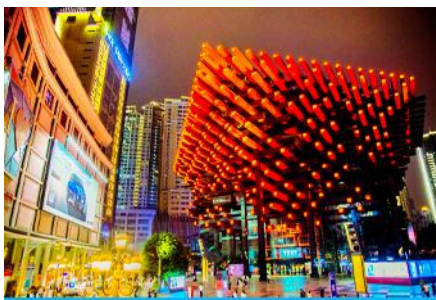
หอศิลป์กั๋วถั่ง