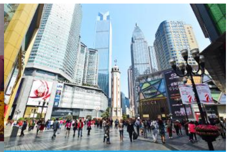
ย่านเจี๋ยฟ่างเปย