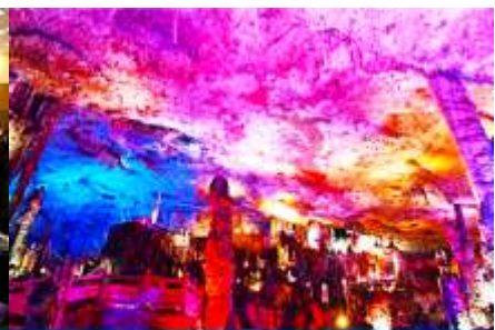
ถ้าเก้าสวรรค์-อุทยานฟง