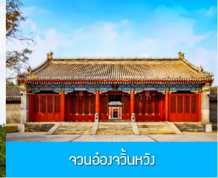
จวนอ๋องจวินหวัง

วันที่หก เมืองเออร์ดอส –อี้เค่อเอาเป่า–พิพิธภัณฑ์เครื่องเงิน-จวนอ๋องจวินหวัง- สวนวัฒนธรรมหมงกุ๋หยวน หลิว- ช้อปปิ้งถนนคนเดิน