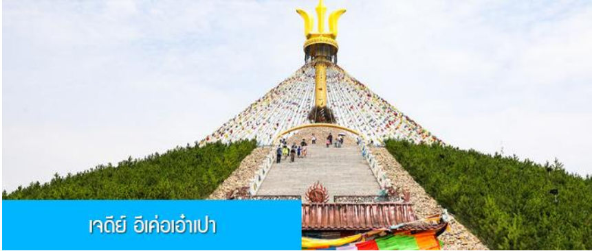
เจดีย์ อี้เค่อเอาเป่า

พักที่ DALAETQI SHNAGJING HOTEL โรงแรมระดับ 4 ดาวหรือเทียบเท่าในเมืองต้าลาเท่อ