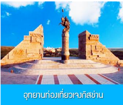
อุทยานท่องเที่ยวเจงกิสข่าน