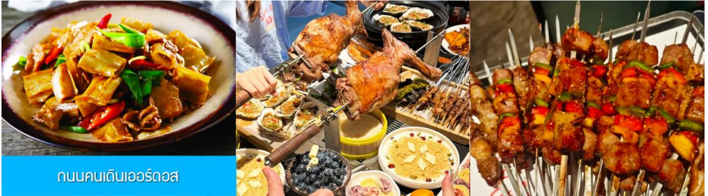
ถนนคนเดินเออร์ดอส

นำท่านเที่ยวชม สวนวัฒนธรรมหมงกู่หยวนหลิว 蒙古源流 เป็นอุทยานท่องเที่ยวเชิงประวัติศาสตร์และวัฒนธรรมระดับ 4A ของจีน ที่เป็นต้นกำเนิดของชนชาติและวัฒนธรรมมองโกล สะท้อนความเป็นจักรวรรดิที่ยิ่งใหญ่เมื่อ 700 ปีก่อน ชม ประตูงเทียน 崇天门 สุคนโทพารที่แสดงถึงความยิ่งใหญ่ของจักรวรรดิมองโกล ชม จัตุรัสเถิงเก้อหลี่ 腾格里广场 จัตุรัสกลางแจ้งขนาดใหญ่ที่ใช้ประกอบพิธีกรรมต่าง ๆ