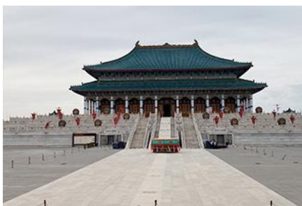
สวนวัฒนธรรม หมงกุ๋หยวนหลิว

หลังอาหารนำท่าน เที่ยวชม จวนอ๋องจวินหวัง 郡王府 จวนแห่งนี้เริ่มสร้างขึ้นในปี ค.ศ. 1902 สร้างเสร็จในปี ค.ศ. 1936 เป็นที่พำนักของ อ๋องอี้จวินหวัง 伊旗郡王 เป็นจวนอ๋องเพียงหนึ่งเดียวที่ได้รับการอนุรักษ์ในสภาพที่สมบูรณ์ โครงสร้างทำด้วยอิฐ หิน และไม้ ประกอบด้วยห้องพัก 16 ห้อง เป็นสถาปัตยกรรมผสมแบบมองโกล ทิเบต และฮั่น