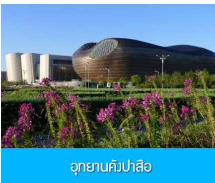
อุทยานคังปาสือ