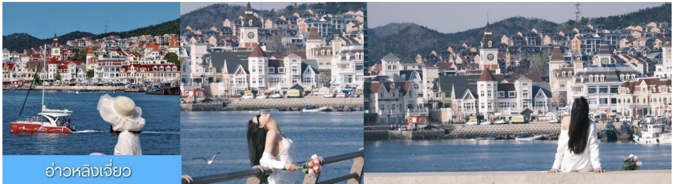
อ่าวหลังเจี้ยว

หลังอาหารเช้านำท่าน เที่ยวชม ท่าเรือประมงหู่ทาน 大连渔人码头 เป็นจุดเช็คอินที่โดดเด่นด้วยสถาปัตยกรรมสไตล์ยุโรปสีสันสดใส ผสมผสานกลิ่นอายเมืองท่าดั้งเดิมเข้ากับบรรยากาศสุด โรแมนติกที่เต็มไปด้วยเรือประมง คาเฟ่ ร้านอาหาร และจุดชมวิวยามทะเล