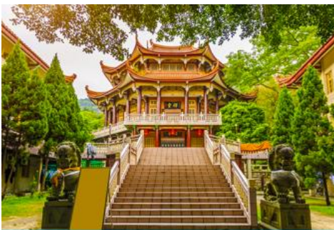
วัดหนานถ้าวชื่อ

ค่ำ รับประทานอาหารค่ำ ณ ภัตตาคาร (1) พักที่ โรงแรม XIAMEN HENGLONG HOTEL 4* หรือเทียบเท่าในเมืองเซี่ยเหมิน