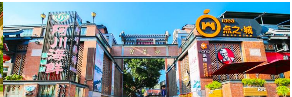
หมู่บ้านชาวประมง เจิงจ้าวอัน