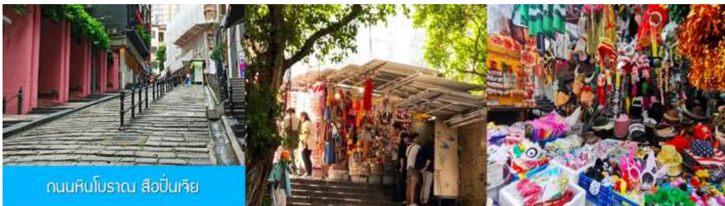
ถนนหินโบราณ สือปิ่นเจีย