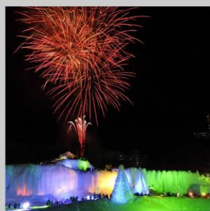
"SOUNKYO ICE FEST"