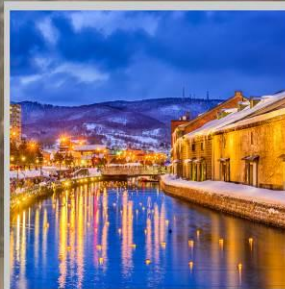
"OTARU CANAL FEST"