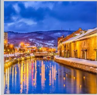
"OTARU CANAL FEST"