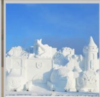
"ASAHIKAWA SNOW FEST"