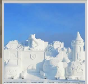
"ASAHIKAWA SNOW FEST"