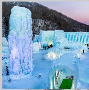
"LAKE SHIKOTSU FEST"