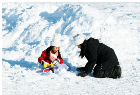
Playing in the snow