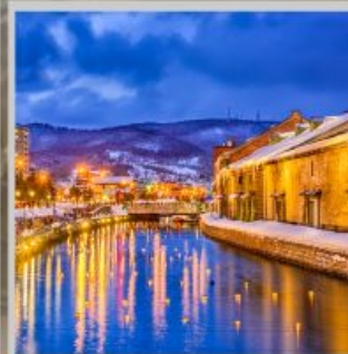
"OTARU CANAL FEST"