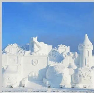
"ASAHIKAWA SNOW FEST"