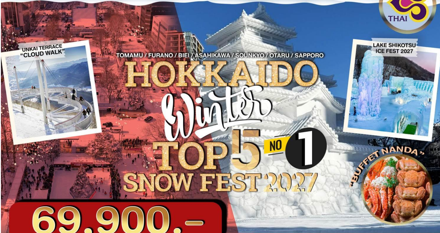
UNKAI TERRACE "CLOUD WALK"

TOMAMU / FURANO / BIEI / ASAHIKAWA / SOUNKYO / OTARU / SAPPORO