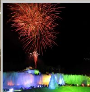
"SOUNKYO ICE FEST"