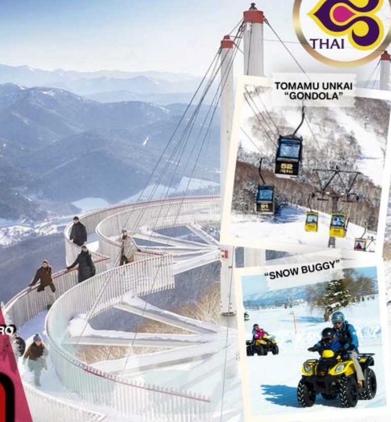
TOMAMU UNKAI "GONDOLA"