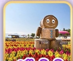
สวนซิกิโซโนะโอกะ