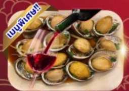
ซีฟู้ด เป้าอ้อ+ไอน์แดง