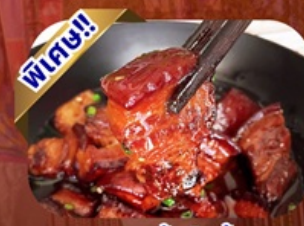
เมนูหมูสามชั้นตุ๋นน้ำแดง

พักโรงแรม 4 ดาว ★★★★★ ฟรี ประกันอุบัติเหตุ บริการ อาหารท้องถิ่น