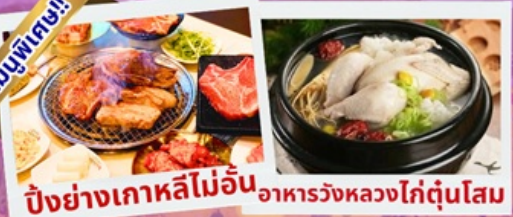
ปิ้งย่างเกาหลีไม่อื่น อาหารวังหลวงไก่ตุ๋นโสม