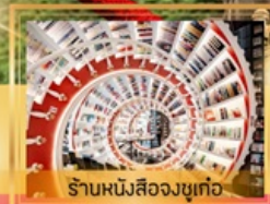
ร้านหนังสือจุกเท่อ