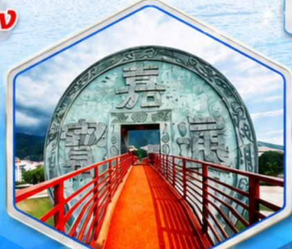
จตุรัสเหรียญโบราณ