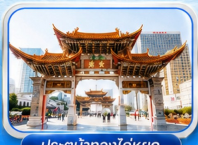
ประตูม้าทองไถ่หยก