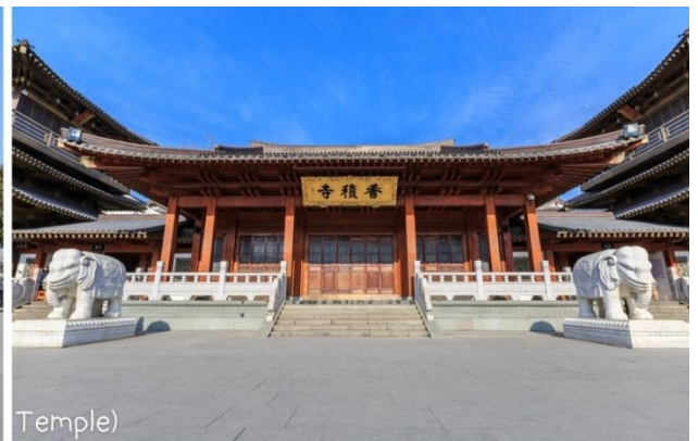
วัดเซียงจี (Xiangji Temple)