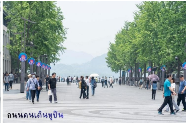
ถนนคนเดินหูปิ่น

นำท่านสู่จุดชมวิวกว้าง City Balcony หรือเฉลียงของเมือง เป็นสวนสาธารณะต้นไม้สีเขียวย่านใจกลางเมือง มีที่นั่งตามขั้นบันได อีกทั้งท่านยังสามารถมองเห็น Intercontinental Hangzhou ลูกบอลสีทอง ห้องพักทุกห้องเปิดรับวิว 360 องศา รวมทั้งตึกเปิดประดับไฟสวยงาม พร้อมชมวิวกว้างทัศนธรรมชาติสวยงามรอบๆ