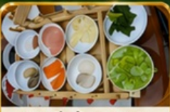
ซุนมินซันสะพาน