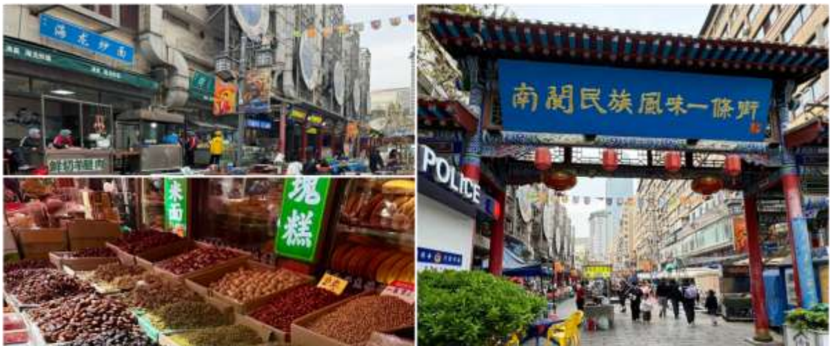
ถนนคนเดินเซี่ยหนานกวน

สมควรแก่เวลานำทุกท่านเดินทางสู่สนามบิน เพื่อทำการเช็คอินกับสายการบิน