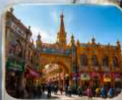
เมืองเก่าคาซการ์ (พิธีเปิดเมือง)