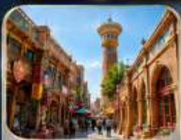
ตลาดอินบาชาร์

** เกี่ยวครบทุกวัน...ไม่ลงร้านช้อปปิ้ง **