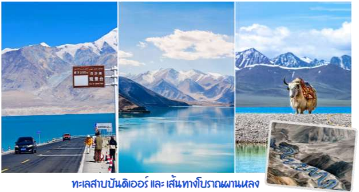
ทะเลสาบบันดิเออร์ และ เส้นทางโบราณผานหลง

นำท่านสู่ ถนนเส้นทางโบราณผานหลง (Panlong Ancient Road) ตั้งอยู่บนที่ราบสูงพามีร์ (Pamir Plateau) เขตเมืองทาชกูร์กัน (Taxkorgan) ทางตอนใต้ของเขตปกครองตนเองซินเจียงอุยกูร์ ประเทศจีน ถนนบนภูเขาที่คดเคี้ยวเลี้ยวลดอันตระการตาในเขตปกครองตนเองทาชกูร์กัน (Taxkorgan) ทางตอนใต้ของซินเจียง ประเทศจีน มีฉายาว่า "ถนนมังกรขด" ขึ้นชื่อเรื่องโค้งหักศอกกว่า 600 โค้ง บนภูเขาสูงชัน เป็นแลนด์มาร์กสำคัญสำหรับสายถ่ายภาพและคนรักการเดินทางที่ต้องการท้าทายฝีมือการขับขี่ ให้ทัศนียภาพที่สวยงามและแปลกตาของแนวภูเขาสูงชันและทะเลทรายในเขตซินเจียง จากนั้นนำท่านเปลี่ยนรถเป็นรถ 7 ที่นั่ง เพื่อเดินทางสู่ทะเลสาบบันดิเออร์ ทะเลสาบบันดิเอร์ (Bandir Blue Lake) หรือ อ่างเก็บน้ำเซียบันดี (Xiabandi Reservoir) เป็นทะเลสาบสีฟ้าครามใสบริสุทธิ์ที่ตั้งอยู่ท่ามกลางเทือกเขาปามีร์ ในเขตปกครองตนเองซินเจียงอุยกูร์ ประเทศจีน ขึ้นชื่อเรื่องวิวธรรมชาติที่สวยงามราวกับภาพวาดและน้ำสีฟ้าเข้มอันเป็นเอกลักษณ์จากการละลายของน้ำแข็ง น้ำสีฟ้าเทอร์ควอยซ์ตัดกับเทือกเขาสีน้ำตาลและท้องฟ้าสีคราม เป็นจุดถ่ายภาพที่ยอดนิยมในเส้นทางชมธรรมชาติบนที่ราบสูงปามีร์