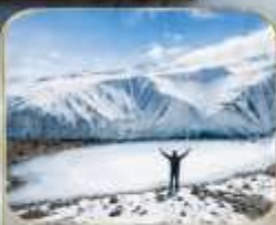
ธารน้ำแข็งมูซตาคาต้า (รวมรถกอล์ฟ)