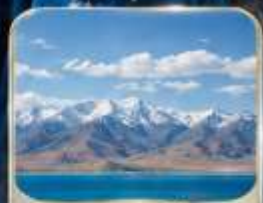
ทะเลสาบชิงไห่ (ไม่รวมรถกอล์ฟ)