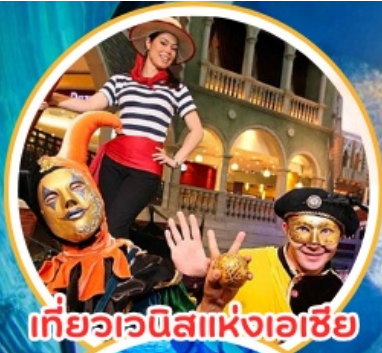
เที่ยวเอเชีย