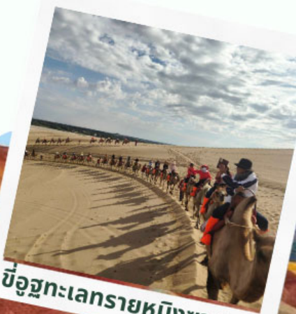
ขี่อูฐทะเลทรายหมิงซาซาน