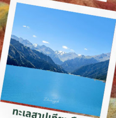
ทะเลสาปเทียนฉี