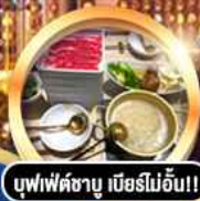
บุฟเฟ่ต์ชาบู เบอร์มอชั่น!!