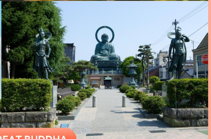
TAKAOKA GREAT BUDDHA