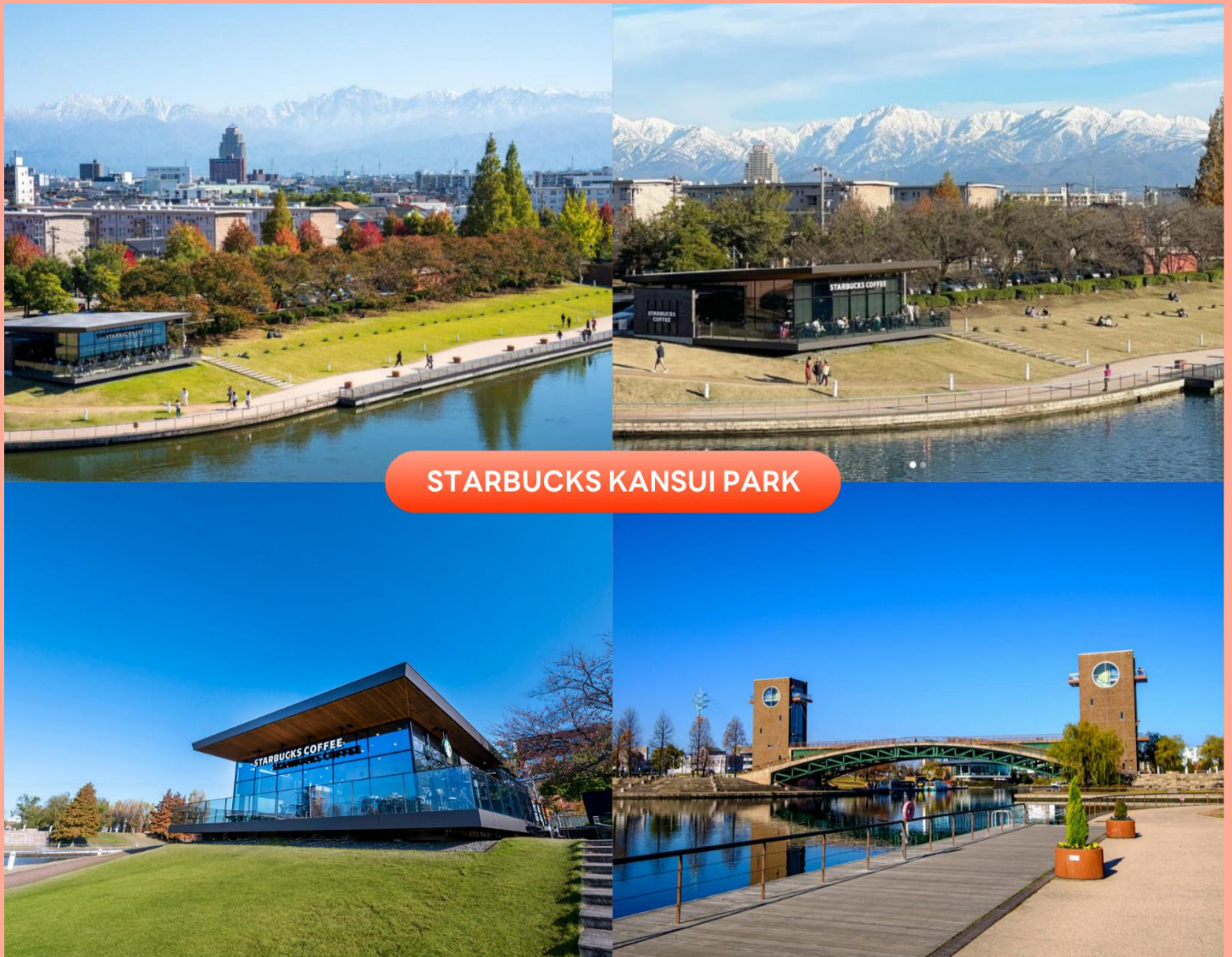
STARBUCKS KANSUI PARK

จากนั้นนำท่านสู่ Starbucks Kansui Park ร้านกาแฟดีไซน์ระดับไฮค็อกนิกที่เคยได้รับการยกย่อง และโหวดให้เป็นสาขาที่สวยงามที่สุดในโลก ตั้งอยู่โดดเด่นริมผืนน้ำภายในสวนสาธารณะคันซุย สวนริมน้ำขนาดใหญ่ที่เป็นปอด และแลนด์มาร์กสำคัญของเมือง ตัวร้านได้รับการออกแบบด้วยกระจกใสบานใหญ่รอบทิศทางในสไตล์มินิมอล กลมกลืนไปกับธรรมชาติรอบตัวอย่างลงตัว ทำให้ไม่ว่าจะนั่งอยู่มุมไหนของร้าน ก็สามารถทอดสายตาสวยงามวิวทิวทัศน์เพลิน ๆ หรือถ่ายรูปเป็นที่ระลึกกับวิวอันงดงามของสะพานข้ามคลอง Tenmon-kyo และผืนน้ำสีครามได้อย่างเต็มตาแบบไม่มีอะไรกัน ถือเป็นไฮไลท์เด็ดที่ห้ามพลาด (ราคาทัวร์ไม่รวมค่าเครื่องดื่ม) (การเปลี่ยนสีของใบไม้ ขึ้นอยู่กับสภาพอากาศเป็นสำคัญ)