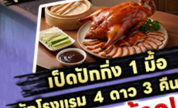
เปิดปักษ์ 1 มื้อ

ไฮไลท์ สุดจ้าว! พักรูม 4 ดาว 3 คืน ขึ้นลิฟท์แก้วชมความอลังการ กลางหุบเขา