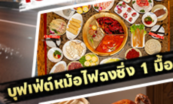
บุฟเฟ่ต์มือโหลงซิง 1 มื้อ