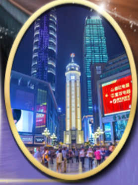
ถนนคนเดินเจียฟางเป็ย