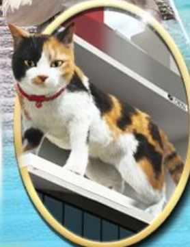
ซัปโปริง ชินจูกุ