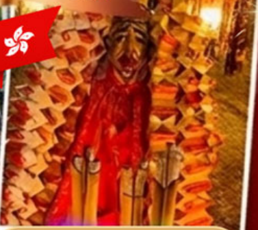
เดินทาง ก.พ. - ส.ค. 69