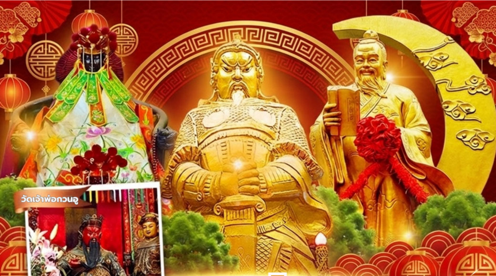
วัดเจ้าพ่อกวนอู