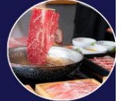
ปิ้งย่างพรีเมียม ROKKASEN เนื่อคุณภาพ