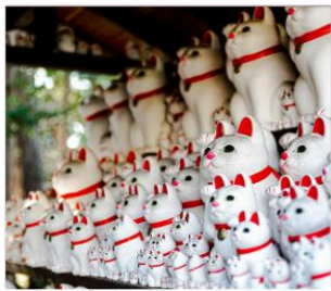
วัดโคโตคุจิ(วัดแมว)