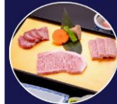
บุฟเฟ่ต์ ชาบูสโตล์ญี่ปุ่น