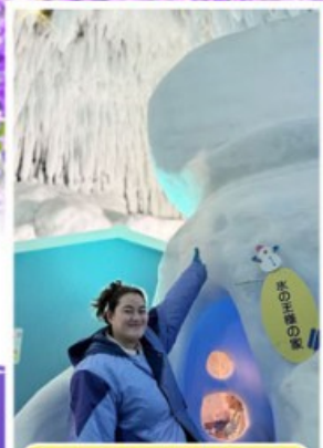
พิพิธภัณฑ์น้ำแข็ง