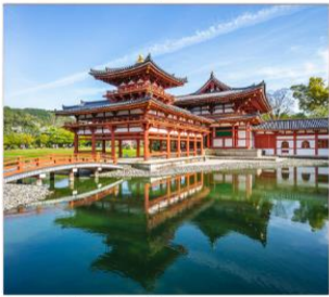
วัดเมียวโดอินและ ถนนซาเจียว