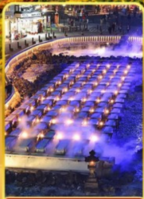
ชมยูมาทากะ