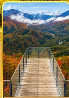
ฮาคุบะอิวาตาคะ