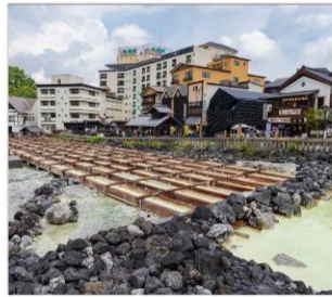
ชมยูมาทาเกะ