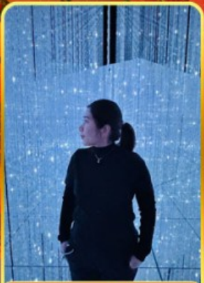
ทีมแอปโตเกียว