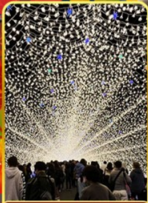
นาบะนะโนะซากาโตะ