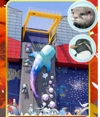
พิพิธภัณฑ์ไคยุคัง

ออนเซ็น 2 คับ มน.กระเป๋า 23 กก.X2 8Days 5Night