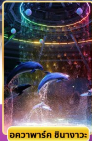
อควาพาร์ค ซินางาวะ