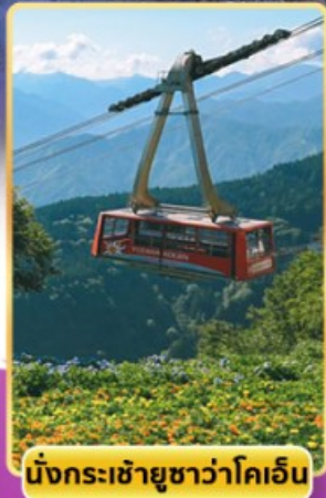
นั่งกระเช้าชูชิวาโคเออิน