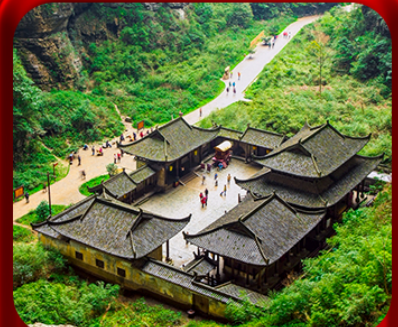
“ อุทยานหลุมฟ้าสะพานสวรรค์ ”