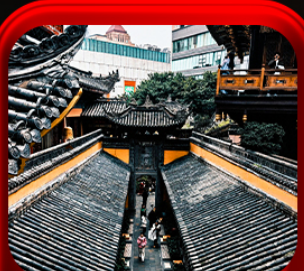
“ วัดหลิวฮั่น ”