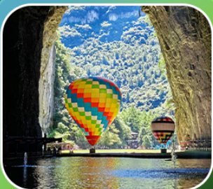
"ถ้าถึงหลง"

เที่ยวจีน 2 มณฑล เสฉวน+หูเป่ย์ (เมืองจงซิ่ง+เมืองเจินฉือ) • ถ้าถึงหลง ล่องเรือมังกรกังซู่ยชมวิวยามค่ำคืน • ผิงซานแกรนด์แคนยอน (รวมล่องเรือ) หงหยาดัง • วัดหลิวอัน • ถนนคนเดินเจียฟางเป่ย์ • ตึกตะเกียบ