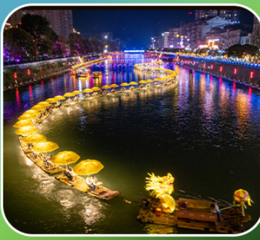
"ล่องเรือมังกรกังซู่ย"