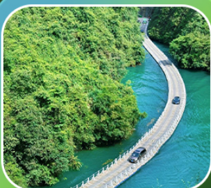
"หุบเขาสิงโต ชื่อจื่อกวน"