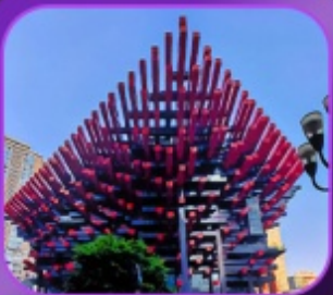
"อาคารตะเกียบ"