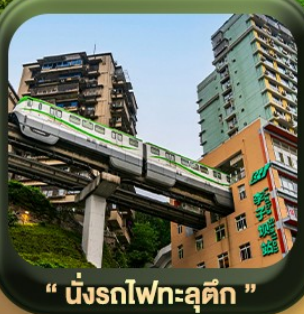
“ นั้งรถไฟทะลุตึก ”

บินตรงลงจงซิง • อุหลง หลุมฟ้าสะพานสวรรค์ • ระเบียบแก้ว • อุทยานเขานางฟ้า หงหยาดัง • นั้งรถไฟทะลุตึก • ศาลาประชาคม (ด้านนอก) • หลงหมินฮ่าว มรดกโลกผาหินแกะสลักต้าจู้ • วัดหลัวฮั่น • ตึกตะเกียบ • ถนนคนเดินเจียฟางเป่ย์