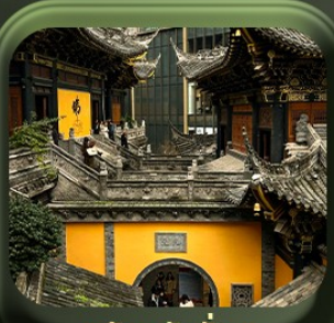
“ วัดหลัวฮั่น ”