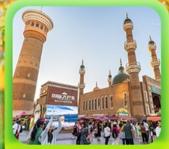
"ตลาดต้าปาจา"

รวมรถไฟความเร็วสูง 1 ขบวน (อ๋หนิง - อูรูมูฉี)