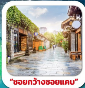
"ชอยกว้างชอยแคบ"