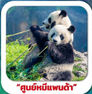
"ศูนย์หมีแพนด้า"