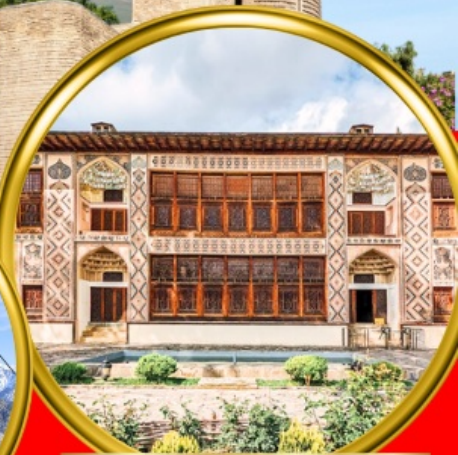
Palace of Shaki Khans