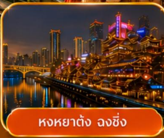
หงหยาดัง ฉงชิ่ง