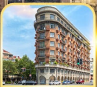
อาคารอู่คัง