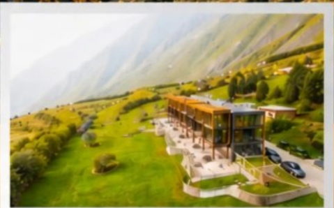
THE ROOM KAZBEGI HOTEL