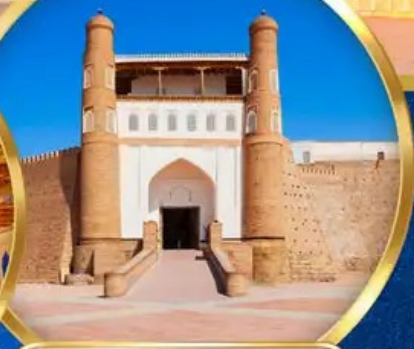
THE ARK FORTRESS