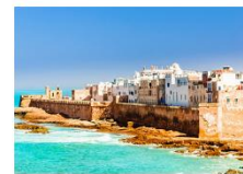
เมืองเอสซาอูอิรา

** พักที่ Adam Park Hotel 5* หรือเทียบเท่า **