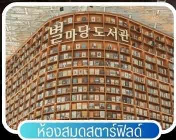
ห้องสมุดสตาร์ฟิลด์