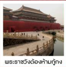
พระราชวังต้องห้ามกรุงปักกิ่ง