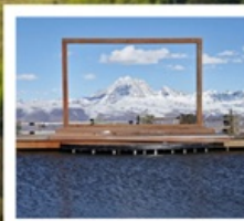
ปาหลางเจียงตู