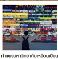
กำแพงมหาวิทยาลัยเหยียนเปียน