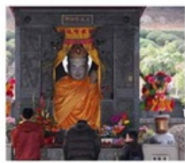
ไต้่องกง