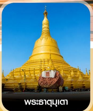
พระธาตุมุเตา