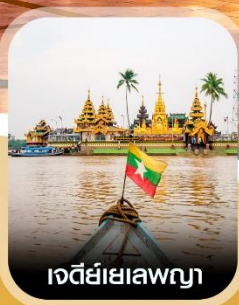
เจดีย์เยเลพญา

✈️ คอนเฟิร์ม ออกเดินทาง ทุกพีเรียด 2 ท่านขึ้นไป