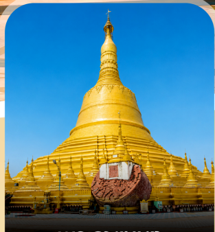
พระธาตุมุเตา