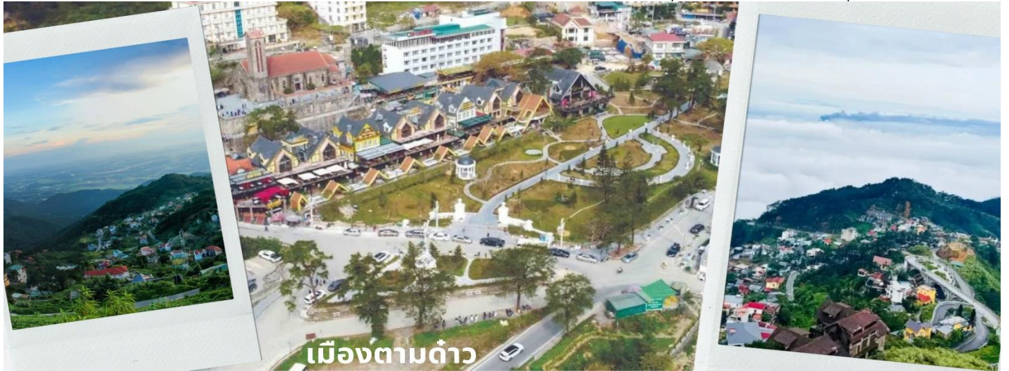
เมืองตามด้าว

สงบ ธรรมชาติอุดมสมบูรณ์ เหมาะกับคนที่อยากหนีร้อนจากในเมืองมาพักผ่อนชิลๆ และที่นี่ยังถูกเรียกว่า Little Sapa และ ดาลัดแห่งภาคเหนือ เนื่องจากเป็นเมืองกลางสายหมอกในหุบเขา และมีความเป็นยุโรปคล้ายกับซาปา