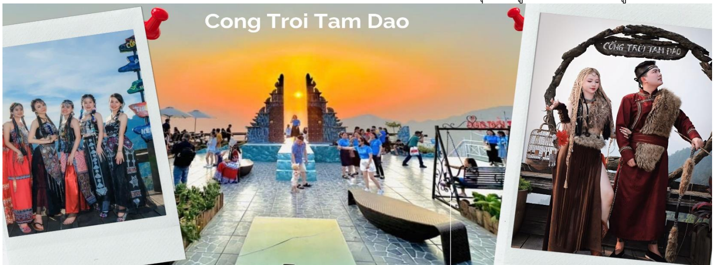
Cong Troi Tam Dao

นำท่านชม ร้านกาแฟ Cong Troi Tam Dao คือหนึ่งในจุดเช็คอินที่โดดเด่นที่สุดในเมืองตามด้าวตั้งอยู่บนยอดเนินเขาที่สามารถมองเห็นวิวเมืองตามด้าวได้ทั้งเมือง สถาปัตยกรรมที่นี่ มีกลิ่นอายแบบยุโรปคลาสสิกด้วย ชุ่มประตุนหิน ทรงโค้งที่ตั้งตระหง่านอยู่ริมหน้าผา เปรียบเสมือนกรอบรูปขนาดยักษ์ที่ล้อมรอบทิวทัศน์ของขุนเขาและทะเลหมอกเอาไว้ โดยเฉพาะในช่วงเช้าและช่วงเย็นที่หมอกจะไหลผ่านชุ่มประตุน ทำให้บรรยากาศดูลึกลับ