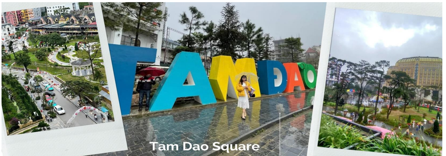
Tam Dao Square

นำท่านสู่ จัตุรัสตามด้าว ตั้งอยู่ใจกลางเมือง โดดเด่นด้วยน้ำพุขนาดใหญ่ รายล้อมไปด้วยร้านค้า ร้านอาหาร โรงแรม และคาเฟ่มากมาย บางวันมีการแสดงดนตรีสดให้ได้ชม บรรยากาศศีกศึกษามาก และไฮไลท์ที่พลาดไม่ได้ก็คือ ป้ายขนาดใหญ่ที่เขียนว่า “ Tam Dao ” เป็นจุดที่นักท่องเที่ยวนิยมมาถ่ายรูปกัน ถือเป็นการเช็คอินว่ามาถึงตามด้าวแล้ว